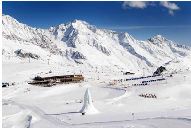
Das Stubaital: Egal ob Winter...