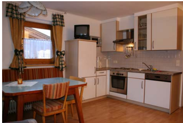
Wohnküche im Appartment „Kreuzjoch“

2-6 Personen (60m 2 ) im Parterre. Große Küche, komplett eingerichtet mit Geschirrspüler, Mikrowelle, und Backofen. Große Esssitzecke und 2-Personen-Schlafsofa, Kabel-TV. Ein Schlafzimmer mit einem Doppel- und einem Einzelbett. Badezimmer mit Wanne und WC und ein separates WC. Zusatzbetten im Vorraum für 2 Personen möglich. Ab Euro 45,00 pro Nacht für 2 Personen, jede weitere Person Euro 15,00.