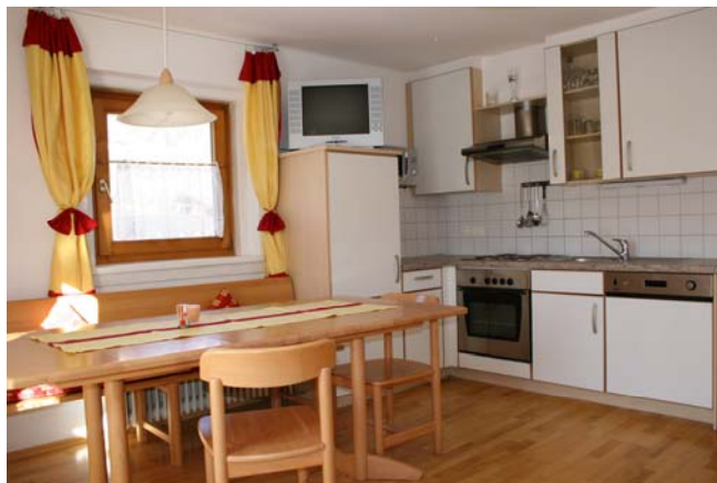
Wohnküche im Appartment „Elfer“

Ab Euro 70,00 pro Nacht für 4 Personen, jede weitere Person Euro 15,00.