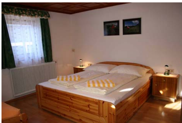
Schlafzimmer im Appartment „Kreuzjoch“