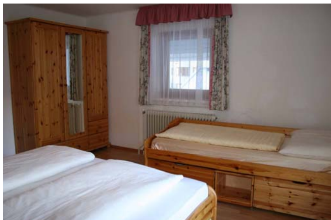
Schlafzimmer im Appartment „Elfer“