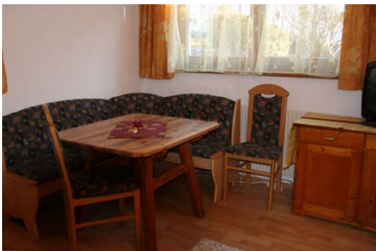
Wohnküche im Apartment „Serles“